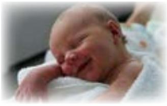
Pro TV Media

El Nacional Centrarse en Abuso infantil y negligencia