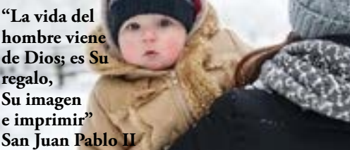
“La vida del hombre viene de Dios; es Su regalo, Su imagen e imprimir” San Juan Pablo II

Por favor comuníquese con la Oficina de la Iglesia con anticipación para inscribirse en una clase.